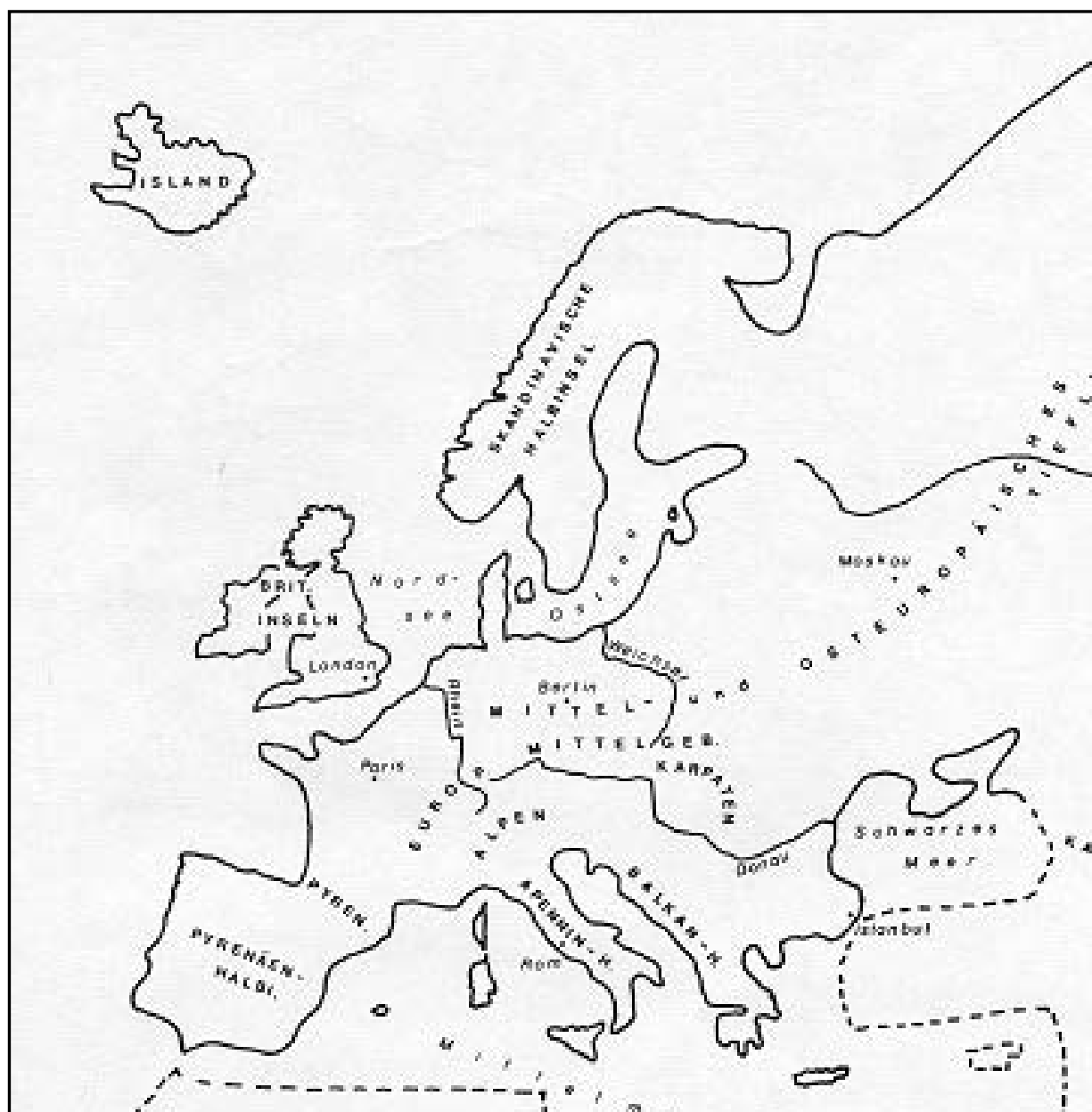
Abb. 1 : Vorschlag für das Grobraster Europa (BÖHN & HAVERSATH 1994, S. 13)

onen des Arbeitskreises der Geographiedidaktiker an bayerischen Universitäten vor. Sie enthalten eine Auswahl an Staaten, Hauptstädten, Wirtschaftsmetropolen, die großen morphologischen Einheiten und Gebirgszüge sowie bedeutsame Flüsse, Nebenmeere und Ozeane. Ohne das differenzierte Feinraster für den Nahraum der Schüler umfas-